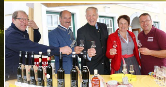
Beste Unterhaltung beim Kriecherl- und Michaelikirtag Schönbach

Mit Unterstützung von Bund, Ländern und Europäischer Union