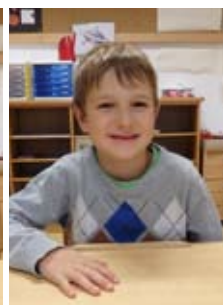
Mario Göß Oberer Markt 2