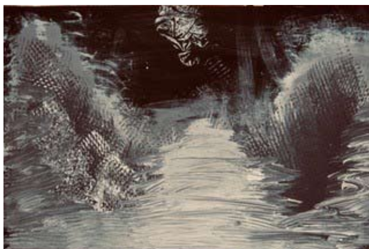
Abb.: B. Höchtl 2019 40x50cm Gouache auf Holzplatte

Anmeldung und nähere Informationen: malschule@gmx.at oder 0664/73402147.