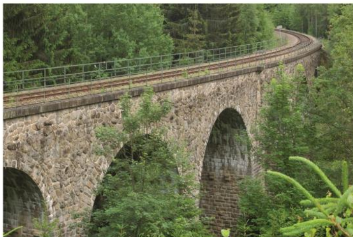
Die ARGE Kremstalweg und die Wirtschaftsregion Waldviertler Kernland laden am Pfingstmontag – 16. Mai 2016 – ein, einen Teil des Kremstalweges neu zu entdecken. Die diesjährige Strecke führt vom Granitland ins Gneisgebiet der Spielberger Ebene.

von Bad Traunstein nach Ottenschlag am Pfingstmontag, 16. Mai 2016