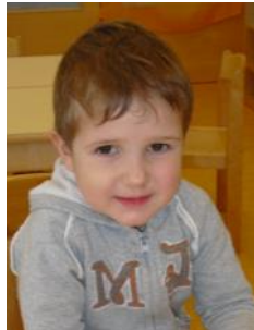
Mario Göß Oberer Markt 2