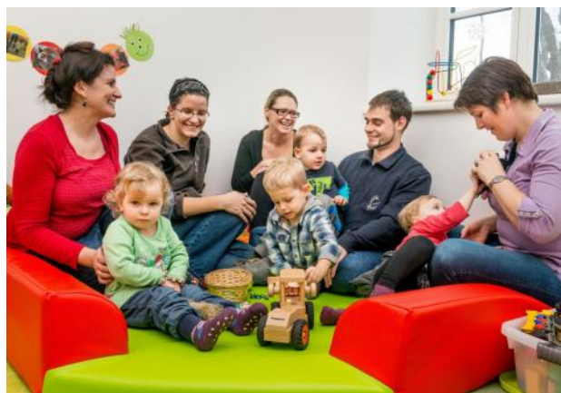
Natürlich sind auch Väter in Karenz herzlich willkommen!

Infos und Termine: www.waldviertler-kernland.at oder 02872/20079-22.