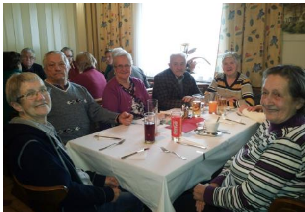
Gemeinsam essen und ein paar schöne Stunden verbringen – das ist gut fürs Gemüt und für die Gemeinschaft.

Infos und Monatsprogramm: www.waldviertler-kernland.at oder 02872/20079-40.