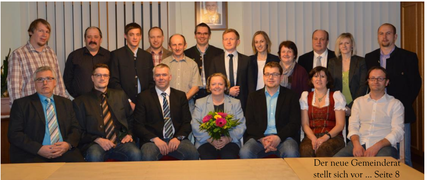
Der neue Gemeinderat stellt sich vor ... Seite 8