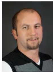
GR Roman Rameder Wanderwege, Freizeit/Sport, Adventmarkt