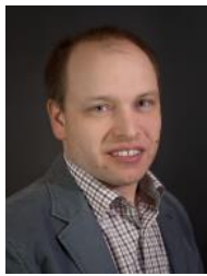
GR Gerald Neuwirth Straßenbeleuchtung, Verkabelung, Erntedank