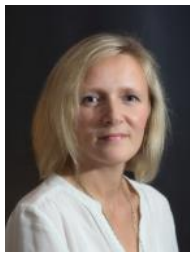
GR Birgit Höchtel Spielplatz